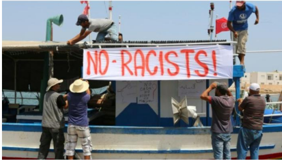
Des pêcheurs mobilisés à Zarzis contre le C-Star.

Début juillet, le projet « Defend Europe » était lancé par le réseau européen d'extrême droite Génération identitaire : le navire C-Star est donc affrété afin d'empêcher les embarcations de migrants d'arriver en Europe. Leur moyen : voguer au large des côtes libyennes et prévenir les garde-côtes libyens lorsqu'une embarcation de migrants est repérée, afin que ceux-ci viennent les récupérer (voir l'article de Libération (France) du 13 juillet).